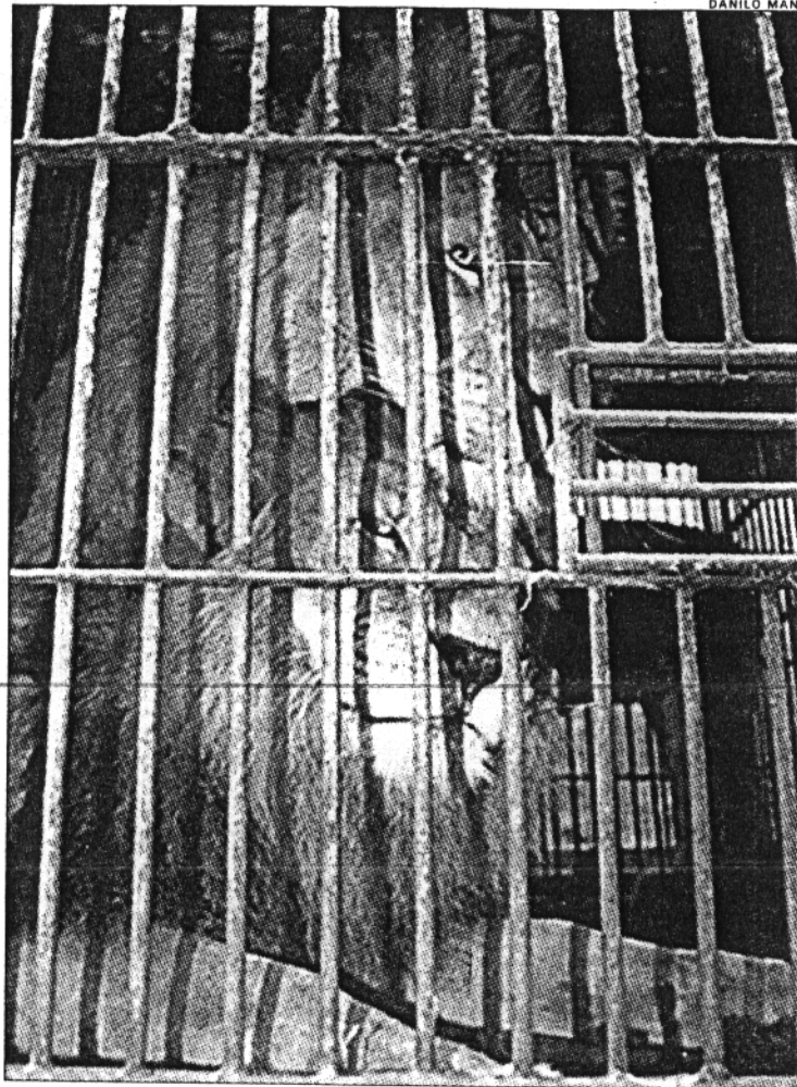
TRÊS LEÕES e uma leoa foram deixados em jaula enferrujada

O Departamento de Controle do Uso de Imóveis (Contru) anunciou ontem que fará vistoria no Jardim Zoológico e no Simba Safári, na Zona Sul. Os parques, nunca vistoriados pela Prefeitura, devem ser visitados pelos técnicos na terça e quarta-feira. Segundo Venturelli, a vistoria faz parte do programa de fiscalização de locais que mantêm animais selvagens confinados.